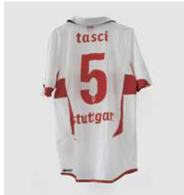
Aus Stuttgarter Stadtgeschichten: Fußballtrikot des Spielers „Serdar Tasci“