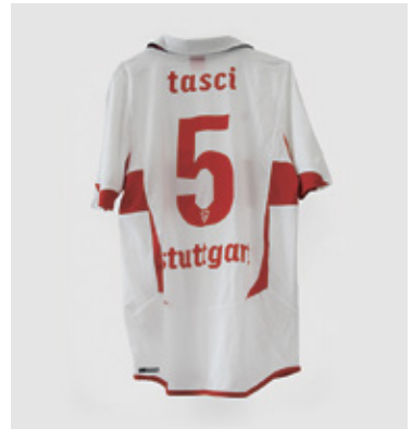
Aus Stuttgarter Stadtgeschichten: Fußballtrikot des Spielers „Serdar Tasci“