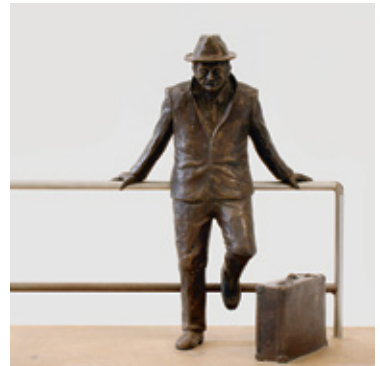
Aus Stuttgarter Stadtgeschichten: Bronzeskulptur, 1982 „Der Ausländer“