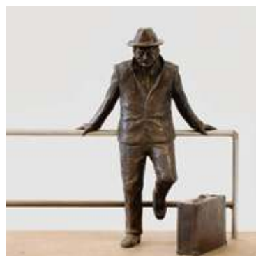
Aus Stuttgarter Stadtgeschichten: Bronzeskulptur, 1982 „Der Ausländer“